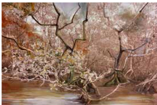
Jardins possíveis (2016), de Juliane Fuganti. Fotografia e acrílica sobre tela, 80 X 120 cm. R$ 8.335.