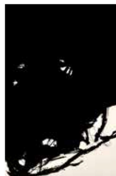
Sem título (2017), de Marcelo Conrado. Técnica mista sobre tela, 150 X 100 cm. Preço sob consulta.